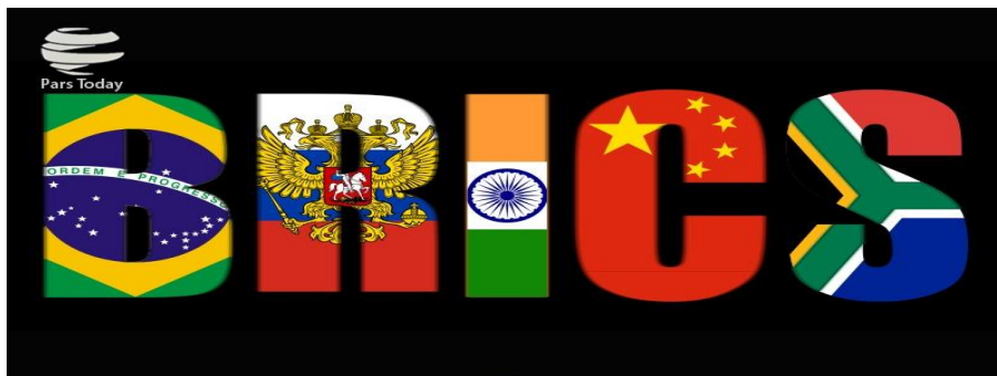
(۱) د غړو هیوادونو ده نومونو دسر حروف او پکې د اړونده هیواد بیرغ

بیلانیره ۲۰۰۹جون ۱۶م کال اوله رسمي جلسه د روسي یکاترینبورگ ښار کې ترسره شوه. ۲۰۱۱م کال کې ورسره جنوبي افریقا هم یوځای شوه چې له دی سره یې نوم له بریک څخه بریکس ته تغیر شو. ۲