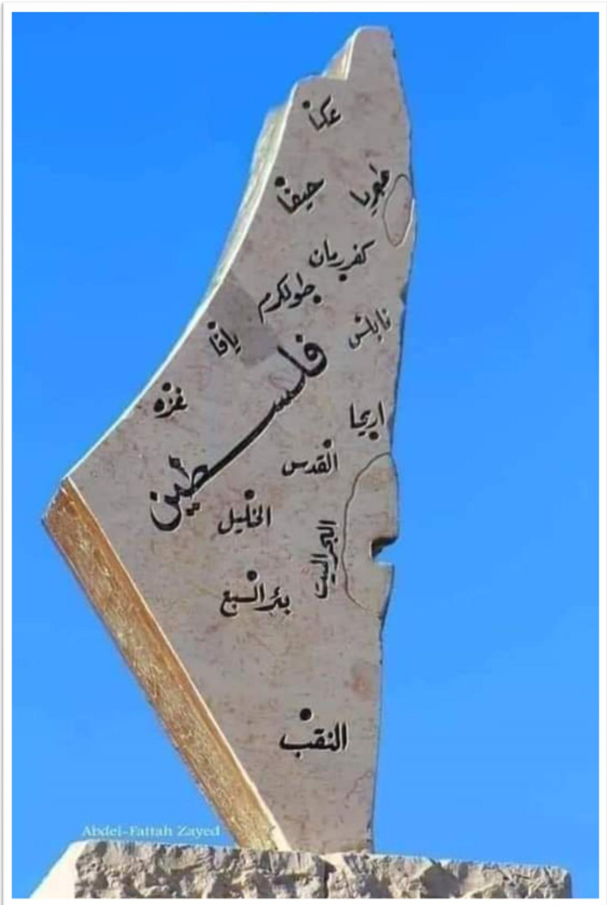
د فلسطین هېواد اصلي نقشه چې تل به زمونږ په زړونو کې وي.