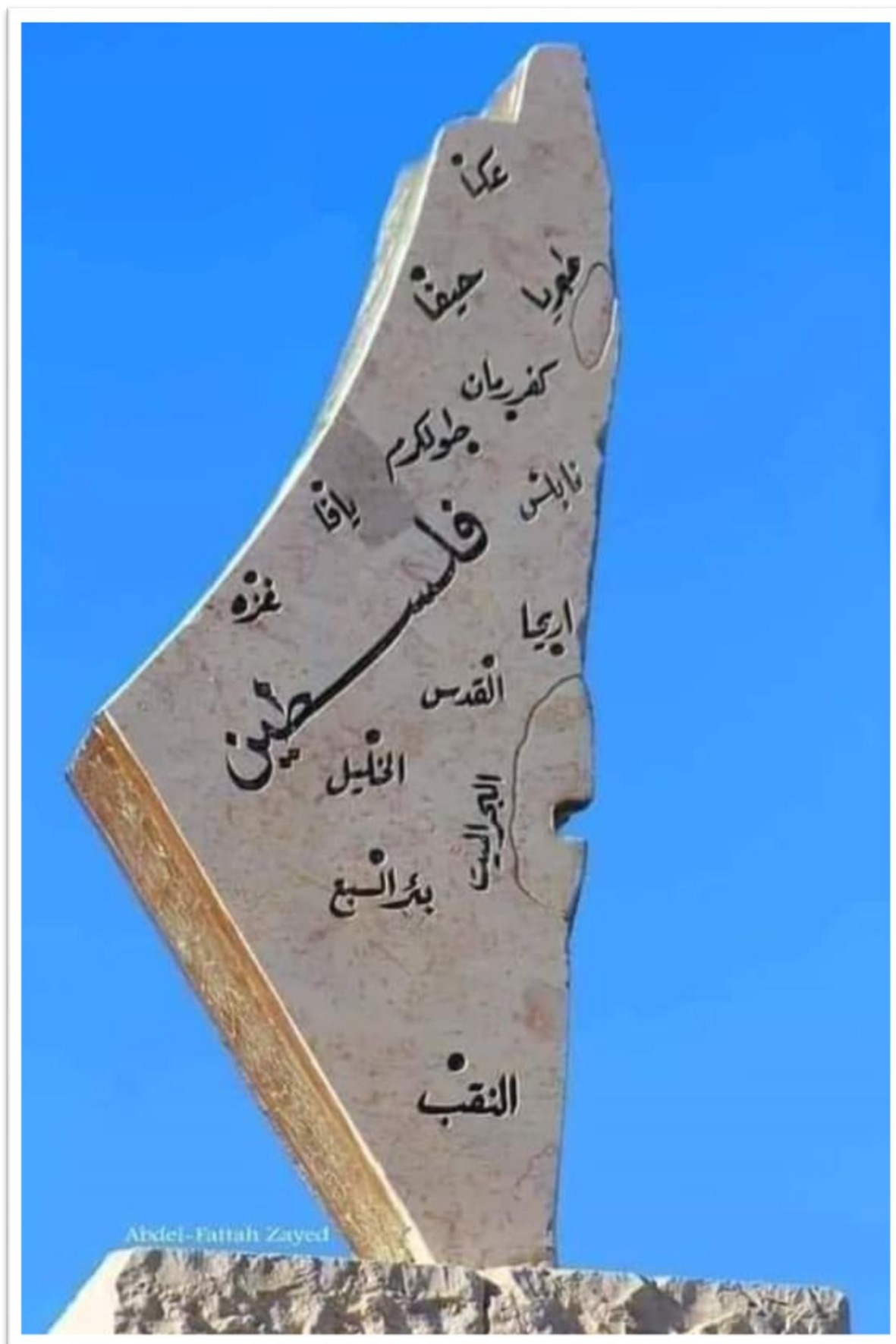
د فلسطین هېواد اصلي نقشه چې تل به زمونږ په زړونو کې وي.