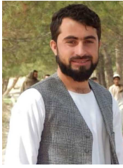
نصیب الله زاهد