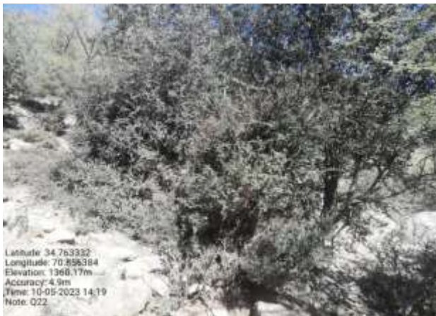
شکل (۲۲): د بیرې بنودنه کوي