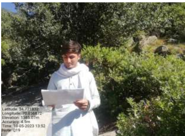
شکل (۲۴): د د ډیتا راټولولو بنودنه کوي