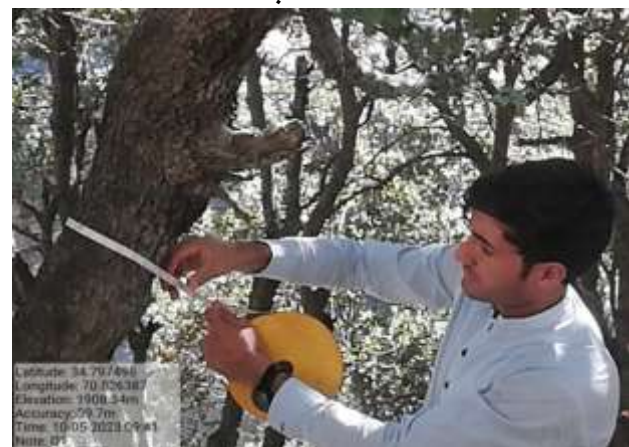
شکل (۲۱): د قطر اندازه کولو بنودنه کوي