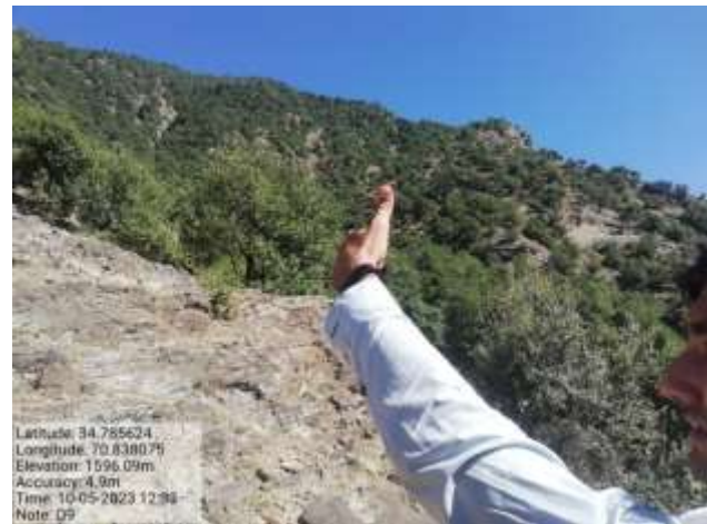
شکل (۲۳): د ونې د ارتفاع د اندازه کولو بنودنه