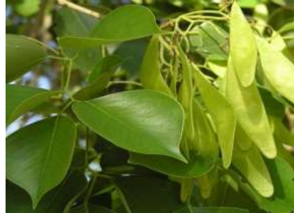
شکل (۱۹): د شوې بنودنه کوي