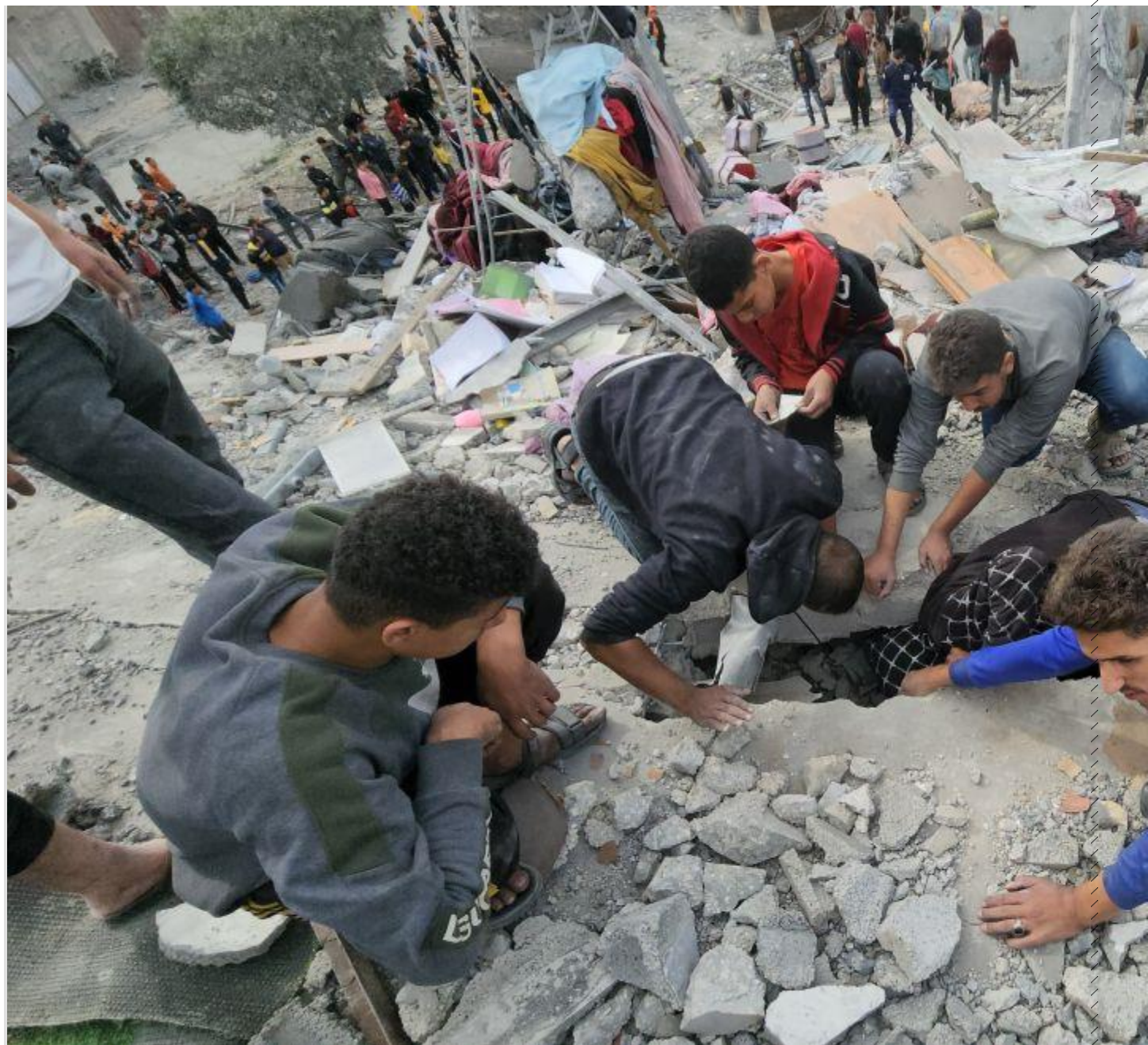
فلسطينيان د اسراييلو د هوایي برید له امله د ويجار شوي کور د خځلو لاندې د قربانيانو د رايستلو لپاره په خپلو لاسونو کثافات راوباسي