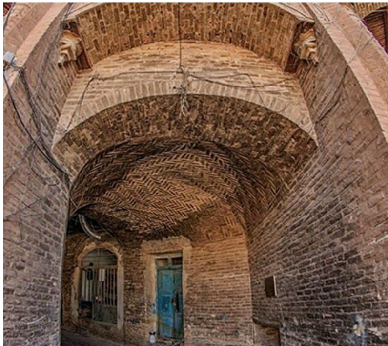
د هرات کاروان سرای انځور د مفکورې ورکولو په اړه