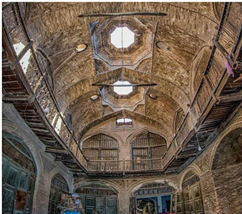
د هرات کاروان سرای انځور د مفکوري ورکولو په اړه