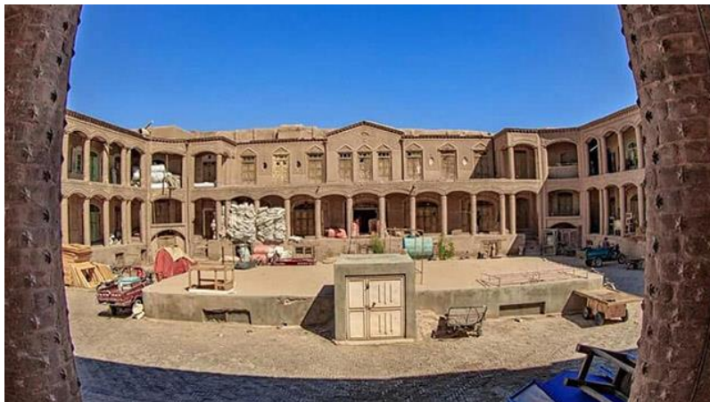
د هرات کاروان سراي انځور د مفکورې ورکولو په اړه

د صفویانو په دوره کې د کاروانسرایونو په منځ کې د شاه عباسي کراچ کاروانسرای دی چې د شاه سلیمان صفوي په وخت کې د ۱۰۷۸ او ۹۱۱۰ ترمنځ جوړ شوی و.