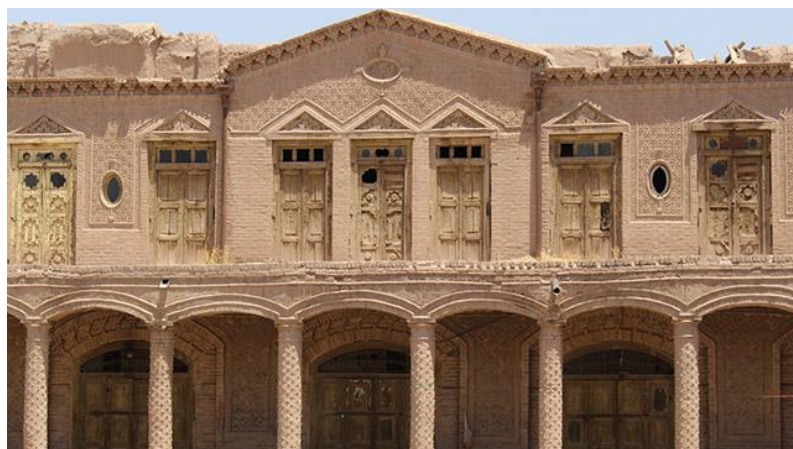
د هرات کاروان سرای انځور د مفکوري ورکولو په اړه