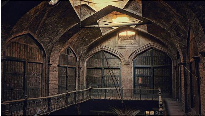
د هرات کاروان سرای انځور د مفکوري ورکولو په اړه