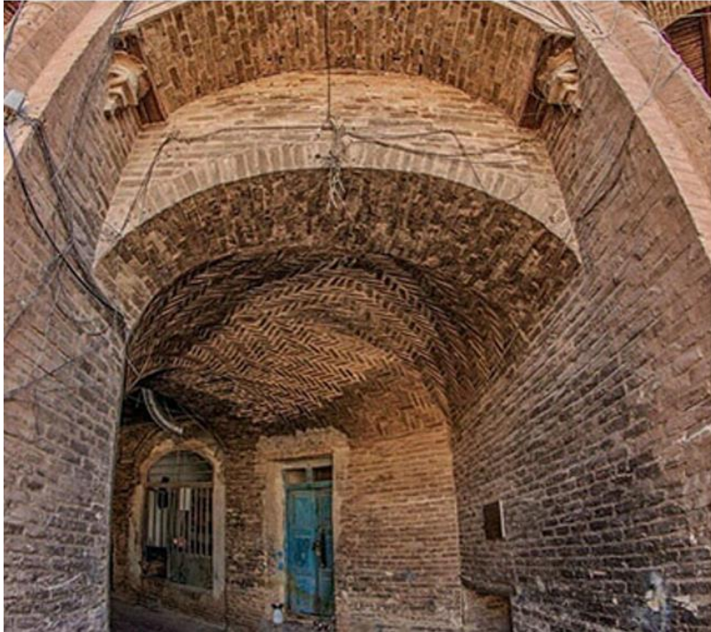
د هرات کاروان سرای انځور د مفکورې ورکولو په اړه