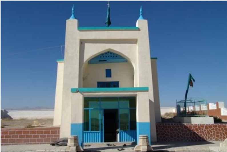
د پوی بهلول مقبره د غزني ولايت زور بنارکي