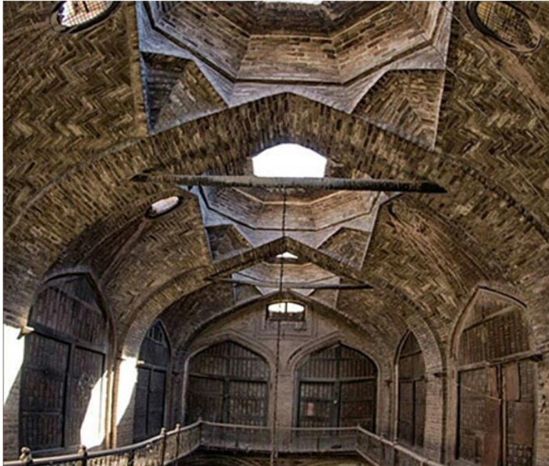
د هرات کاروان سرای انځور د مفکورې ورکولو په اړه