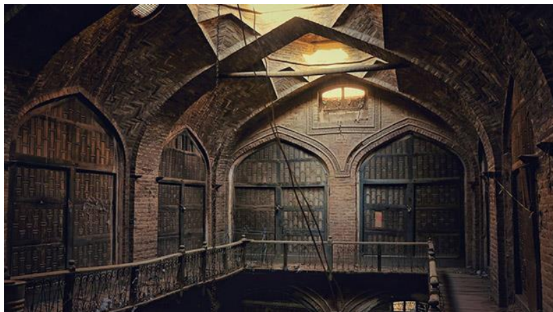
د هرات کاروان سرای انځور د مفکوري ورکولو په اړه