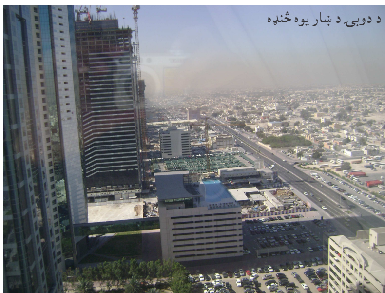
د دوبي د بنار يوه څنډه

بهرامي ورسره گپ شپ شروع کړ، موټروان وويل: موږ چې کله له ميدان څخه سورلي اخلو، نو شل روپۍ (درهمه) پرې له ميدانه اتومات چارجوو او نور د کيلو ميټر په حساب، په يوه کيلو ميټر يو درهم اخلو، کله چې هوټل ته ورسېدو د کيلو ميټر ستن