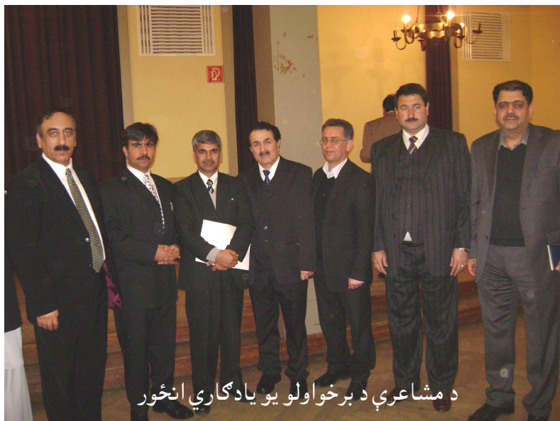
د مشاعرې د برخوالو یو یادگاري انځور

تکرار نه کړو. اوس افغانستان د گرمو ذهنونو او نظرونو د سپښت په مرحله کې دی، دا بېړۍ باید په ښه ډول خپله لاره ووهي او تردې وروسته د یو ایډیال نظام د جوړولو په فکر او لټه کې شو. دولت جوړونه او د هغه استحکام یوه اوږده پروسه ده، چې باید په دقت