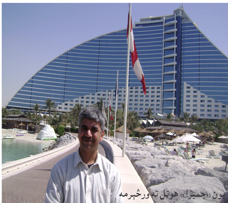
يون «جميرا» هوتېل ته ورځېرمه