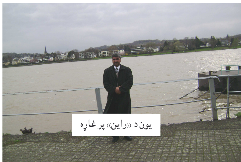
يون د «راين» پر غاړه

ترهغه وروسته سيداغا ماما وويل: راځه د راین غارو ته لاړ شو.