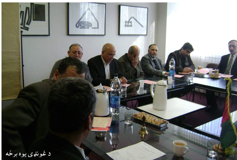
د غونډې يوه برخه

غواړم تاسو ته ناپېيلې معلومات وړاندې کړم، هغه هم هغه معلومات چې ما سره شته، کېدی شي تر زیاته بریده دقیق وي، خو بیا هم سل په سلو کې یې د دقت ادعا نه کوم، له دې خبرو څخه مې هدف دادی، چې کله کله قضاوتونه د پېښو پر واقعیت ولاړ نه وي، نو په همدې وجه واقعیت ته صدمه رسي او عدالت تر پښو لاندې کېږي.