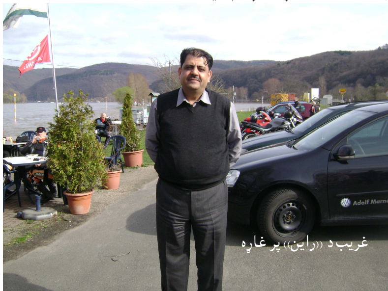
غريب د «راين» پر غاړه

شوي، خو نه لکه زموږ په شان چې هر څه يې پوپناه کړل، دا ودانۍ گورې، اکثره يې اوس هم جوړې دي او بيا بيا ترميم شوي دي. دا نه يوازې همغه وخت د وړو پاچايانو او شهزادگانو ماني وې، بلکې داسې جوړې شوي، چې د جنگي او عسکري چوڼيو کار هم ترې اخيستل کېږي. نو ځکه يې د ځينو ځينې برخې د همغه وخت د جگړو له امله ويجاړې شوې هم دي.