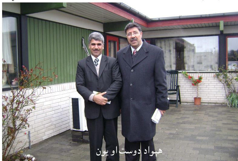
هېواد دوست او یون

رسېدو سره سم خوب لاندې کړو، لس لس نیمې بجې به وي، چې هر یو په خپل نوبت سره له تشنابونو راووت، ځانونه مو تیار کړل،