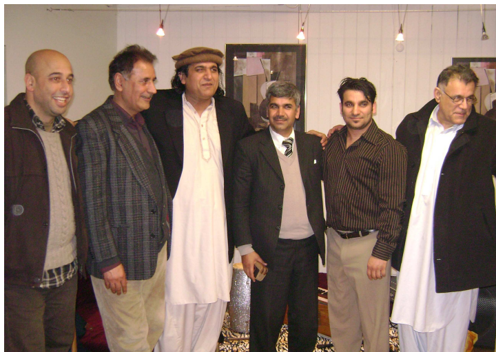
البرز صيب، همايون، يون، بهرام صيب، تنگ صيب او بيکسيار صيب

به وي چي تاسي پروگرام پرمخ بوئي، همايون يو تکره خوان سندرغاري له سويډن څخه رابلل شوي و.