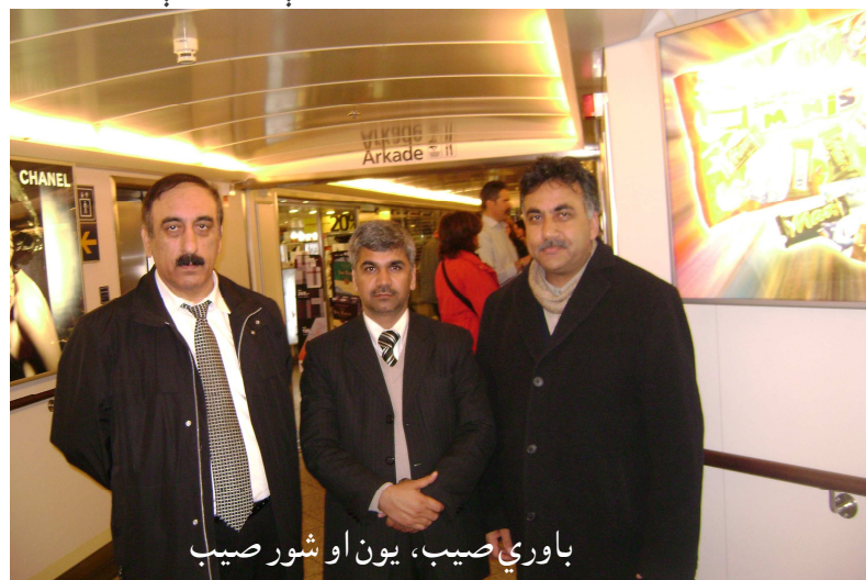
باوري صيب، يون او شور صيب

دویم پورته پورته شو، خورا لوکسه کښتۍ وه، هوټل، د اتیکو او نورو شیانو خرڅلاو پلورنځی و، د ناستې ځای یې درلودل، د