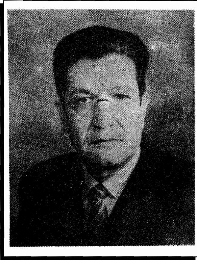
ارواڻباد پوهاند عبدالحي حبيبي