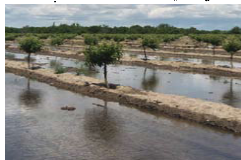
ځوان باغ د يو مخيز اوبه خور لاندي