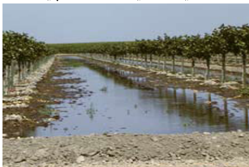
پولي لرونکې يو مخيز اوبه خور

د خاوري پر بنياد د مهال ویش مېتودونه (څنگه پوه شو چې څه وخت اوبه ولگوو): اوبه لگول بايد هغه وخت ترسره شي چې 50% اوبه له خاوري څخه جذب شوي وي. په خاوره کې د اوبو د محتوا تود معلومولو لپاره يورمبي، بيلچه او ياد خاوري نل را واخلي اود 20 څخه 40 ساتي پورې وکني. هغه خاوره چې تقريباً 50 فيصده اوبه ولري په لاندي ډول احساسېږي: