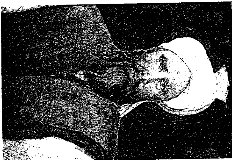
ستر ملی مبارز بایزید روینان