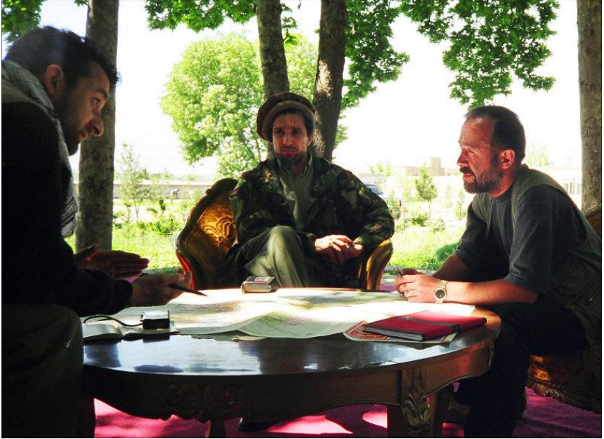
احمد شاه مسعود ، امرالله صالح او روسی پوځي څارگر «الپکساندر کنيازف». د ۱۹۹۸ ز کال د اپرېل مياشت.