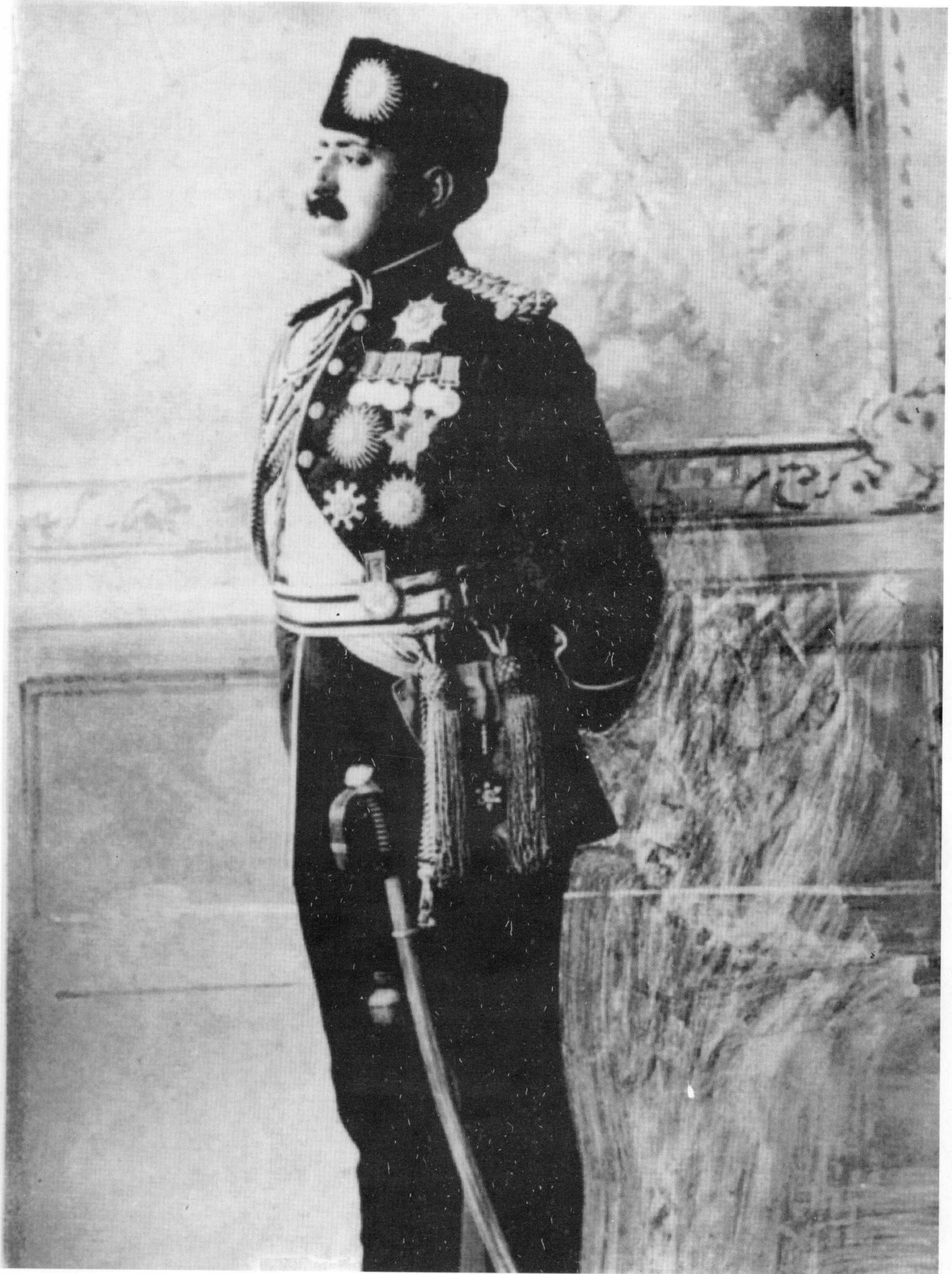
امير امان الله خان