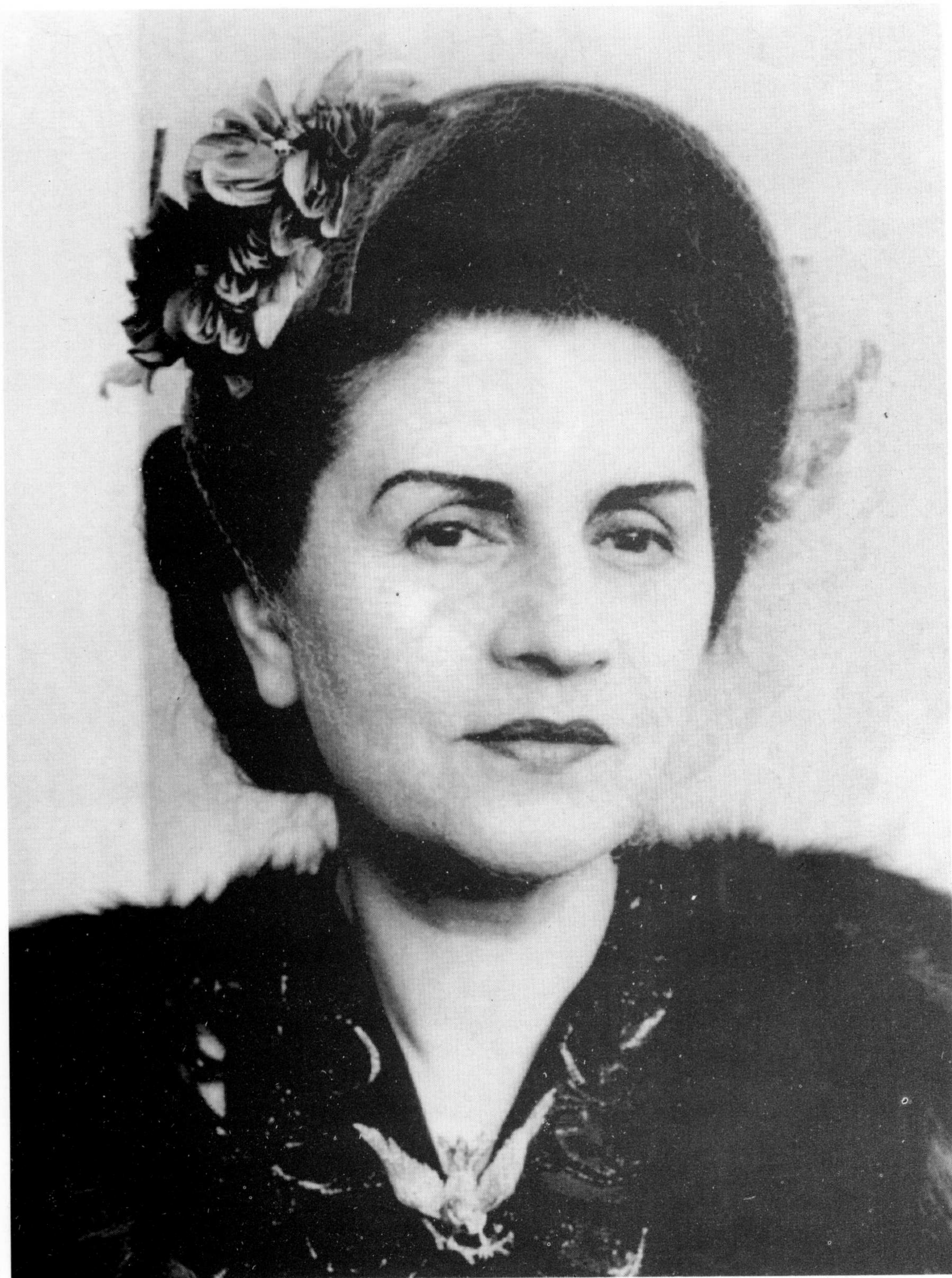
ملکہ ثریا پہ روم (ایتالیا) کی