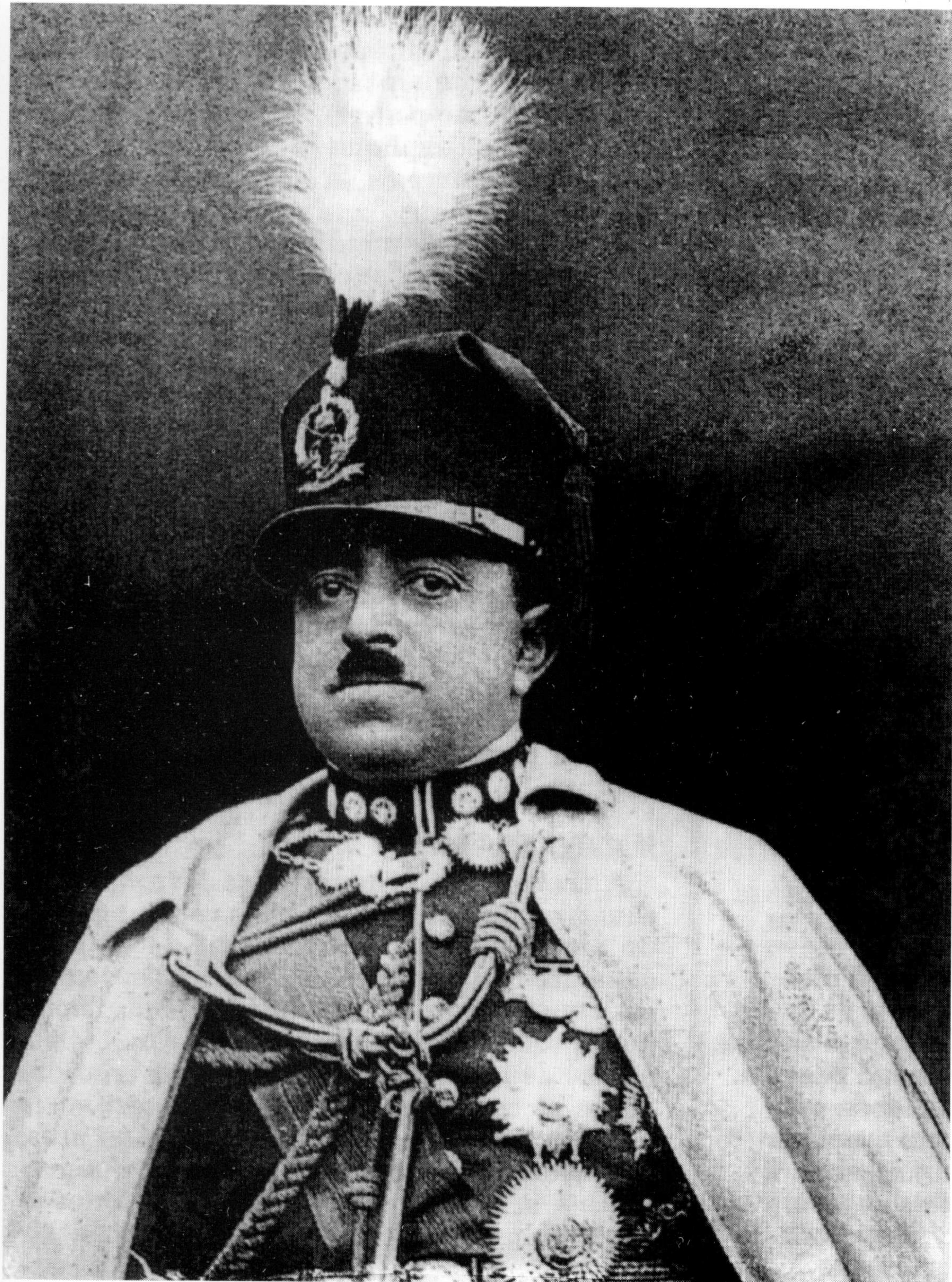
امير امان الله خان په فرانسه کې