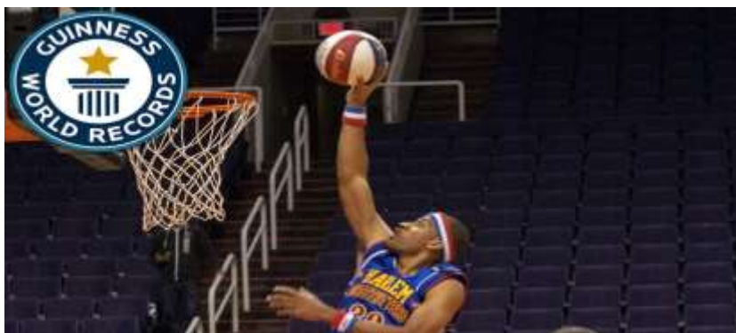
په پوزې باندي د توپ تاوول

د بسکتبال دغه چټک حرکت د (۲۰۱۵) میلادي کال د نوامبر پر (۵) نېټه په (امریکا) کې ترسره شو.