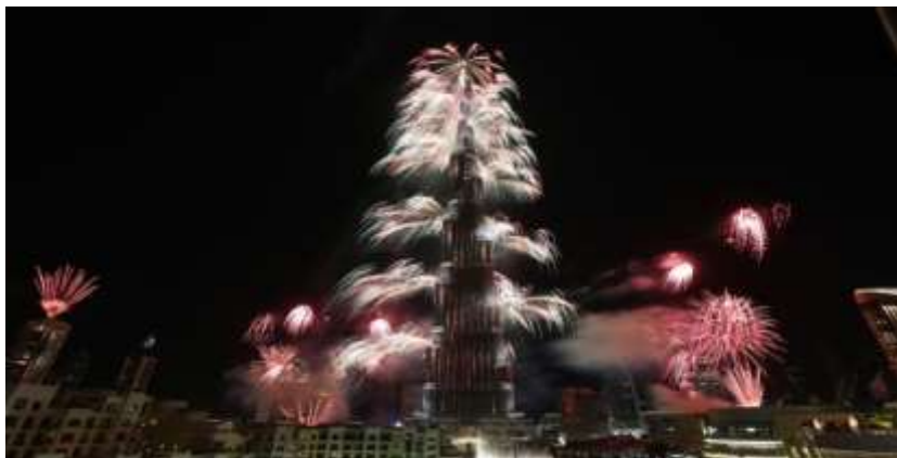
د لوړې سیمې څخه توپ وهل

دغه اور لوبې د دوېۍ ښار په لوړ پوړیزو ودانیو کې ترسره شوې وې، چې په هغوی کې د (خلیفه) او (حرب) لوړ پوړیزې ودانۍ هم شاملې دي، د (۲۰۱۴) م کال د نوي کال شپې اور لوبې (۹۴) کیلومتره ساحه تر پوښښ لاندې و نیوله او د دې ښار څېره یې ور بدله کړې وه.