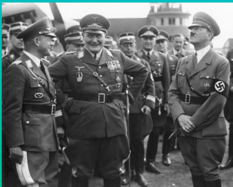
از راست به چپ: آدولف هیتلر، هرمان گورینگ (فرمانده نیروی هوایی)، ارهارد میلش

با آغاز جنگ جهانی دوم در جریان حمله به نروژ، فرماندهی ناوگان پنجم هوایی را عهده دار شد. پس از شکست فرانسه و پیروزی آلمان میلش به مقام فیلد مارشالی رسید. وی همچنین به عنوان مسئول تولید هواپیما برای لوفت وافه منصوب شد که در این سمت موفقیت چندانی نتوانست کسب کند و تولیدات آلمان علی رغم افزایش فوق العاده زیاد تولیدات متفقدین افزایش چشمگیری نداشت. در سال ۱۹۴۴ میلش به همراه هیملر و گوبلز سعی در برکنار کردن گورینگ بدلیل شکست عملیات بارباروسا کردند که در این کار موفق نشدند و میلش مجبور به ترک لوفت وافه شد، و تا پایان جنگ به همکاری با البرت اشپیر وزیر تسلیحات آلمان پرداخت. با شکست آلمان در می ۱۹۴۵ میلش توسط نیرو های بریتانیایی دستگیر شد. وی در دادگاه نورنبرگ محاکمه شد و به دلیل جنایات جنگی و جنایت علیه بشریت به حبس ابد محکوم شد. ولی حکم او در نهایت به ۱۵ سال کاهش یافت، اما در سال ۱۹۵۴ از زندان آزاد شد. میلش ادامه ی زندگی خود را در دوسلدورف سپری کرد و در سال ۱۹۷۲ درگذشت.