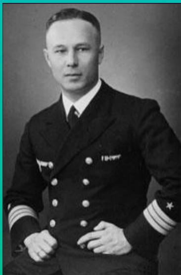
ناخدا دوم پل آشر از خدمه فرماندهی رزمناو بیسمارک

براساس تحقیقات مارتین ریگ، هزاران یهودی در کنار آلمانی ها به خدمت در ارتش نازی ها پرداخته اند، براساس این تحقیقات در حدود ۱۵۰ هزار یهودی در ورماخت خدمت کرده اند که از این تعداد ۲ فیلدمارشال (عالی ترین درجه ی نظامی) ۱۵ ژنرال دیده می شوند، همچنین یهودیانی در خدمت گشتاپو (پلیس مخفی) و همچنین نیروی پلیس خدمت کرده اند. از جمله یهودیان سرشناس در ارتش آلمان می توان فیلدمارشال ارهارد میلش را نام برد از وی به عنوان یکی از معماران نیروی هوایی جدید آلمان (لوفت وافه) و دست راست هرمان گورینگ فرمانده نیروی هوایی آلمان نام برده می شود. براساس این تحقیقات ۱۷ یهودی موفق به کسب نشان صلیب شوالیه از بالاترین نشان های نظامی آلمان شده اند. از جمله معروفترین یهودیانی که در ورماخت خدمت کرده اند می توان به هلموت اشمیت اشاره کرد، وی که در زمان جنگ در نیروی هوایی آلمان خدمت کرده بود پدر بزرگی یهودی داشت، هلموت اشمیت بعد ها به مقام صدر اعظمی آلمان غربی رسید. گفتنی است هلموت اشمیت در زمان جنگ موفق به دریافت نشان صلیب آهنی شده بود. بیش از ۳۰ هزار مدرک و سند توسط مارتین ریگ جمع آوری شده است که بر اثبات پیشینه ی یهودی برخی افسران ورماخت دلالت دارد، در میان یافته های وی اسنادی وجود دارد که به علم و آگاهی مقامات رایش سوم درباره ی پیشینه ی یهودی افسران دلالت دارد برای مثل سندی که در سال ۱۹۴۴ تنظیم شده به یهودی بودن ۷۷ مقام نظامی در ورماخت مربوط می شود. پیشینه ی خدمت یهودیان در ارتش آلمان به جنگ جهانی اول هم می رسد و در میان تعدادی از کهنه سربازان یهودی جنگ جهانی اول هم با تایید مقامات نازی به خدمت خود در ارتش آلمان ادامه دادند.