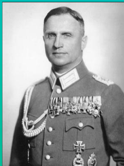
ژنرال هلموت ویلبرگ وی موفق به دریافت نشان صلیب شوالیه همراه با شمشیر شد.