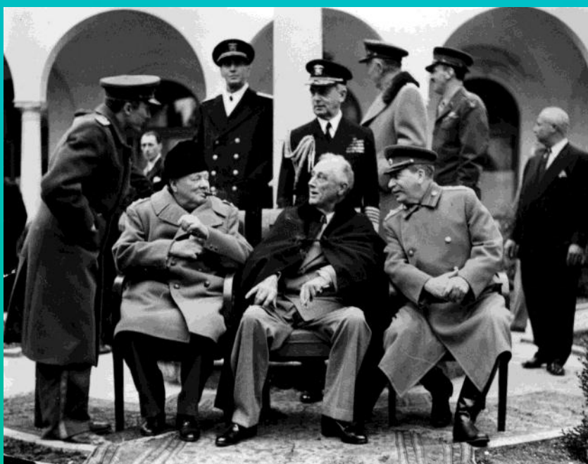
نشسته نفر اول از سمت چپ : وینستون چرچیل نخست وزیر بریتانیا با کت و کلاه خز روسی

آنها اگر تا سال ۱۹۵۰ زنده باشند خوشحال خواهند بود. امروز هیچ انگلیسی (بدون تفکر) قادر به دیدن آن نیست. نخست وزیر بریتانیا در کنفرانس یالتا یک کت خزدار روسی میپوشد. این عمل نظرات ناراضی را در انگلیس تحریک کرد. بعدها زمانی که سازمانهای خبری انگلیس گزارش دادند که آن یک کت خزدار کانادایی بود هیچ کس آن را باور نکرد. مردم در این قضیه نماد فرمانبرداری از خواسته های کرملین را می دیدند. چه به سر آن روزی آمده که انگلستان اهمیت داشت حتی اگر چه که امروزه با قاطعیت!!! در امور جهان دست دارد. یک سناتور با نفوذ آمریکایی اخیرا اظهار داشت: ((انگلستان فقط آپاندیس کوچک اروپاست!!!)). رفقای آن دارند آن را درمان میکنند. آیا سزاوار بهتر از اینهاست!؟