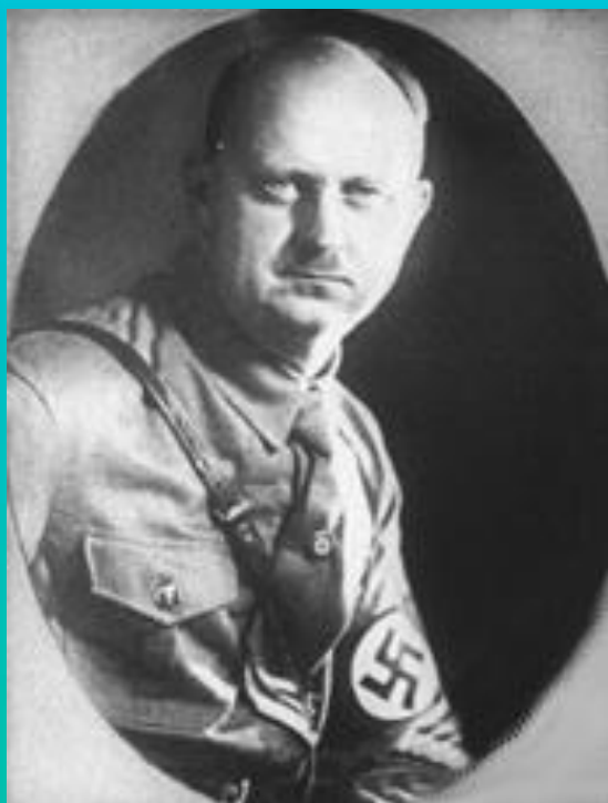
ویلیام گوستاو رهبر شاخه ی سوییسی حزب نازی

با اعلان جنگ یهودیان علیه آلمان جوانان افراطی تحت تاثیر تبلیغات صهیونیسم دست به اعمال خشونت آمیز علیه آلمانی ها زدند، که ترور افراد نازی یکی از این اعمال بود.