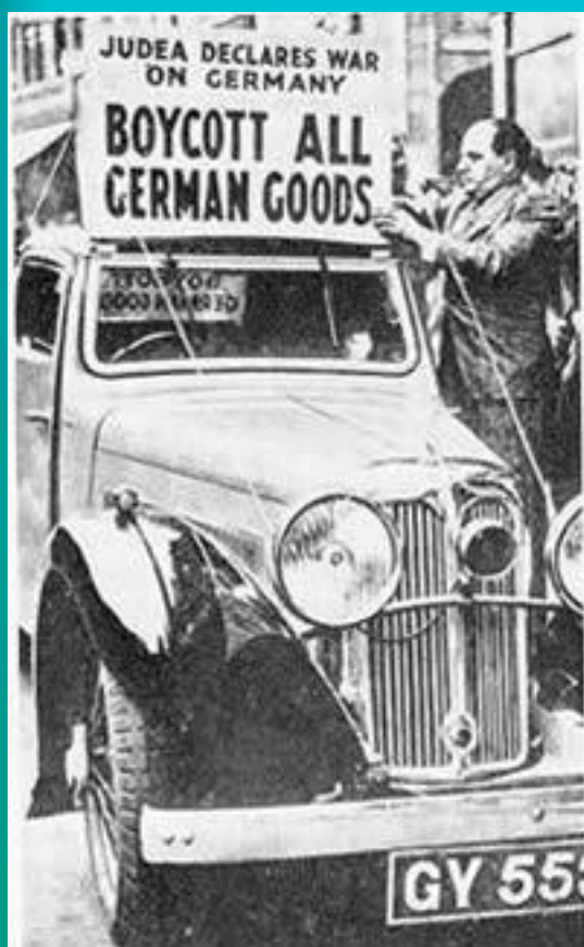
نوشته ی تابلو : کالا های آلمانی را تحریم کنید .

در ۱۲ مارس ۱۹۳۳ کنگره ی یهودیان آمریکا از برگزاری تظاهرات عظیمی علیه آلمان در ۲۷ مارس خبر داد. در این میان روز ۲۳ مارس، ۲۰ هزار یهودی با تظاهرات مقابل دفاتر شرکت های آلمانی در نیویورک خواستار تحریم کالاها و شرکت های آلمانی شدند. دولت آلمان به این حرکت ضد آلمانی اعتراض کرد و خواستار توقف آن شد .