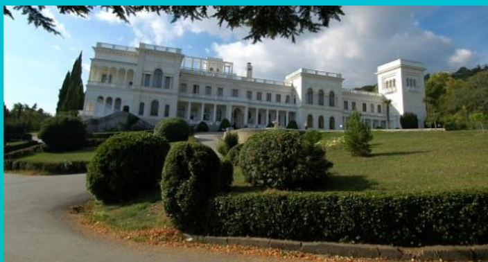
کاخ بیلاقی تزار - میزبان کنفرانس یالتا

کنفرانس یالتا از ۴ تا ۱۱ فوریه ۱۹۴۵ به مدت هشت روز در کاخ بیلاقی تزار در شهر یالتا واقع در شبه جزیره کریمه (جنوب روسیه) در ساحل دریای سیاه تشکیل شد.