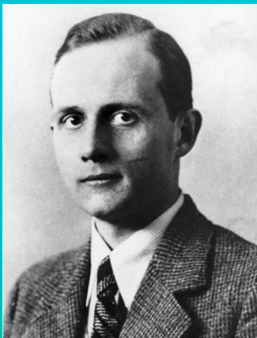
Ernst vom Rath دیپلمات آلمانی در پاریس به دست یک جوان یهودی ترور شد.