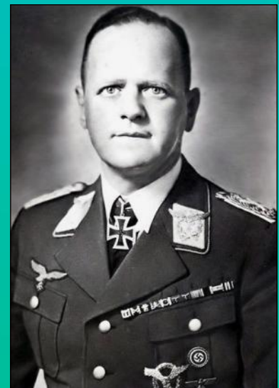
فیلد مارشال ارهارد میلش، مرد شماره ی دو لوفت وافه (نیروی هوایی آلمان نازی)

از جمله مشهورترین یهودیانی که در زمان خدمت جان خود را از دست داده می توان ناخدا دوم پل آشر، از خدمه ی فرماندهی رزمناو معروف بیسمارک نام برد، رزمناو بیسمارک از بزرگترین و پیشرفته ترین کشتی های آن دوران بود و در نبرد با ناوگان بریتانیایی غرق شد. ژنرال هلموت ویلبرگ دیگر یهودی است که در نیروی هوایی آلمان خدمت کرده است همچنین وی در بازسازی مخفیانه نیروی هوایی آلمان پس جنگ نقش داشت. (براساس عهد نامه ی ورسای آلمان از داشتن نیروی هوایی محروم بود) به علاوه در برخی منابع از وی به عنوان یکی از مبتکران حملات رعد آسا یاد شده است.