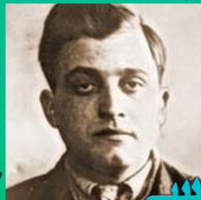
دیوید فرانکفورتز، قاتل گوستاو بعد ها به قهرمان ملی اسرائیل تبدیل شد.

۳ سال بعد آتش جنگ جهانی دوم در اروپا شعله ور می شود که به شکست آلمان می انجامد. با پایان جنگ فرانکفورتز از زندان آزاد شده و به فلسطین نقل مکان می کند. او بعد ها کارمند وزارت دفاع اسرائیل شده پس از مدتی به افسری در ارتش اسرائیل تبدیل می شود. در نهایت دیوید فرانکفورتز در سال ۱۹۸۲ در اسرائیل فوت می کند. از فرانکفورتز دو کتاب به نام های "انتقام" و "اولین مبارز علیه نازیسم" باقی مانده است. گفتنی است فرانکفورتز پس از جنگ به عنوان شهروند افتخاری سوییسی انتخاب می شود و همچنین در اسرائیل به عنوان قهرمان ملی شناخته شده و پس از مرگش خیابان ها و پارک هایی به اسم وی نامیده شده اند. فرانکفورتز از خود به عنوان آغازگر جنگ مقدس علیه آلمان یاد می کرد و این مورد را در خاطرات خود نقل کرده است.