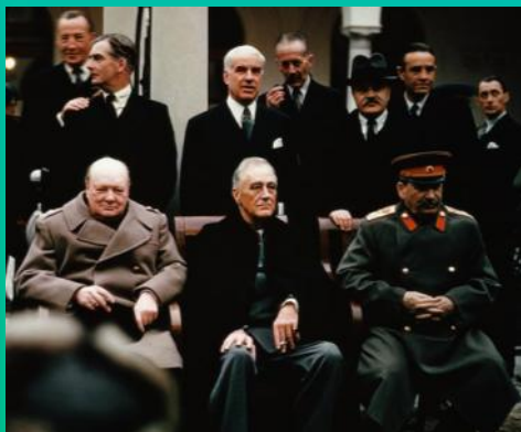
از راست به چپ: ژوزف استالین رهبر شوروی-روزولت (رئیس جمهور آمریکا) وینستون چرچیل (نخست وزیر بریتانیا)

رئیس جمهور امریکا (روزولت) - نخست وزیر انگلیستان (چرچیل) و رهبر شوروی (استالین) با شرکت در این کنفرانس به تصمیم گیری درباره ی وضعیت جهان پس از شکست آلمان که اکنون شکستش محتمل بود، پرداختند. در این کنفرانس جهان سرمایه داری و سوسیالیستی (کمونیستی) ضمن تقسیم جهان و تعیین مناطق تحت کنترل خود به تقسیم غنایم جنگی پرداختند. براساس توافقات این کنفرانس شوروی تمام اروپای شرقی را از آن خود کرد و در آنها دولت های سوسیالیستی به راه انداخت و با نظر مثبت غرب ملت های اروپای شرقی را به زیر پرده ی آهنین خود برد. علاوه بر این در کنفرانس درباره ی محاکمه ی سران آلمان هم بحث هایی انجام شد.