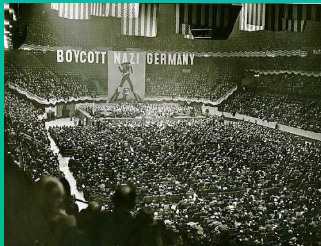
گرده همایی یهودیان در سال ۱۹۳۷ برای حمایت از تحریم آلمان نیویورک

بر روی پلاکاردهای آلمانی ها نوشته شده: آلمانی ها از خود دفاع کنید از یهودی ها خرید نکنید.