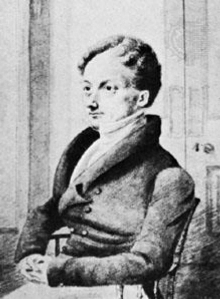
جيمز مل (1807-1858) د جان ستوارټ مل پلار