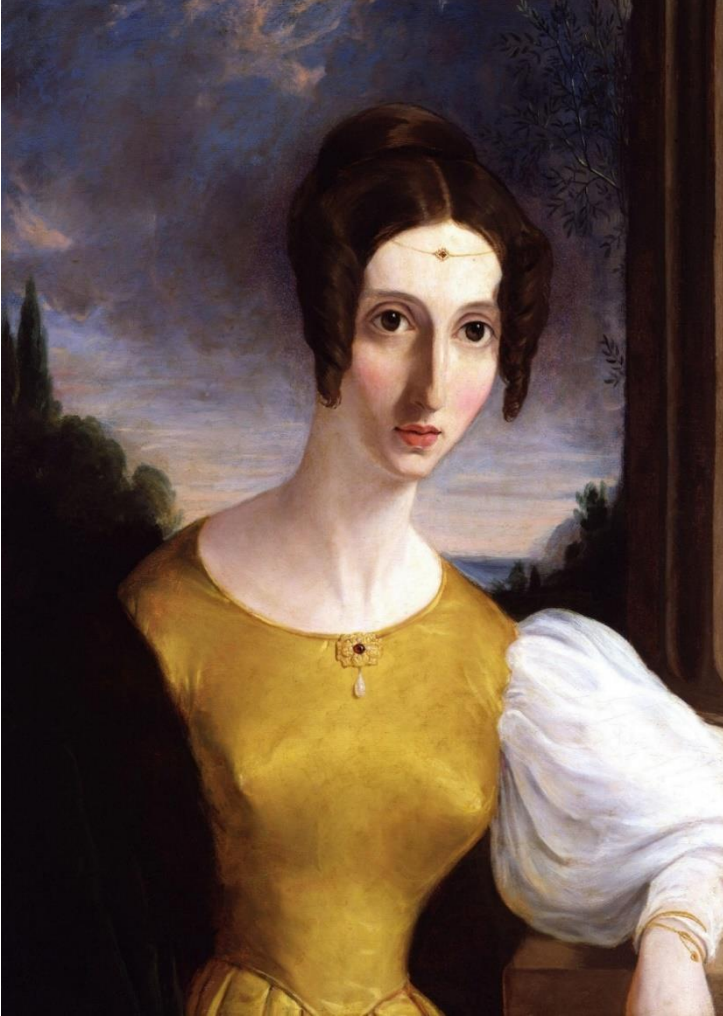
هري یت ټیلر مل (1773 - 1836) د جان ستوارٽ بڼځه