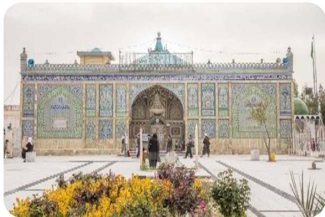
د خرقې شریفې زیارت او جامع مسجد

د دې جامع او د خرقې مبارکې د نوي ودانۍ تاداو د سدوزي تېمورشاه په پاچهي کي په کال (۱۱۸۶ هـ ق) کي کښېښوول سو او د (۱۱۹۰ هـ ق) د روژې د مياشتي په لومړۍ نېټه يې کار بشپړ او مبارکه خرقه يې ورته را نقل کړه. د جامع په ودانۍ کي د وخت په تېرېدو سره بدلونونه راغلي دي، خو د سردرا محمدعثمان خان په وخت کي خاص بدلون پکښي راوستل سو، خو دا اوسنۍ بڼه يې د مرحوم محمدظاهرشاه په پاچهي کي راغلې ده. البته ځيني قبرونه او کورونه ونړول سول او د خرقې مبارکي غولۍ پراخ کړه سو. [۱] د خرقې شريفې د زیارت نقاشۍ د امير حبيب الله خان په پاچهي کي د امير د ورور سردار نصرالله خان په هڅه د صوفي عبدالحميد بارکزي په هنرمندو گوتو سر ته رسېدلې دي. د زیارت د شاوخوا کاشي خښتو کار يوه پلا د وزيرمحمدگل خان په وخت کي چي د کندهار والي و او بيا د عبدالغفور خان په مشرتابه سره