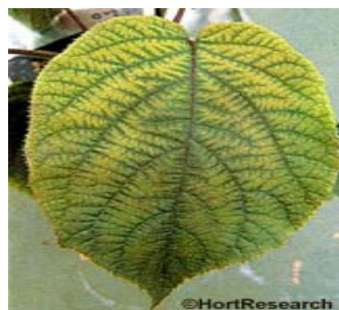
په کی وی فروټ کې د جښتو د کمښت نښه