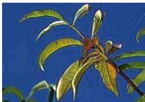
د شفتالو په پاڼو کې د نایتروجن د کمښت نښه