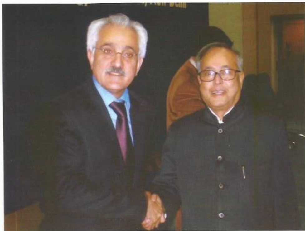
دیدار با پراناب مکرجی، رئیس جمهور هند.