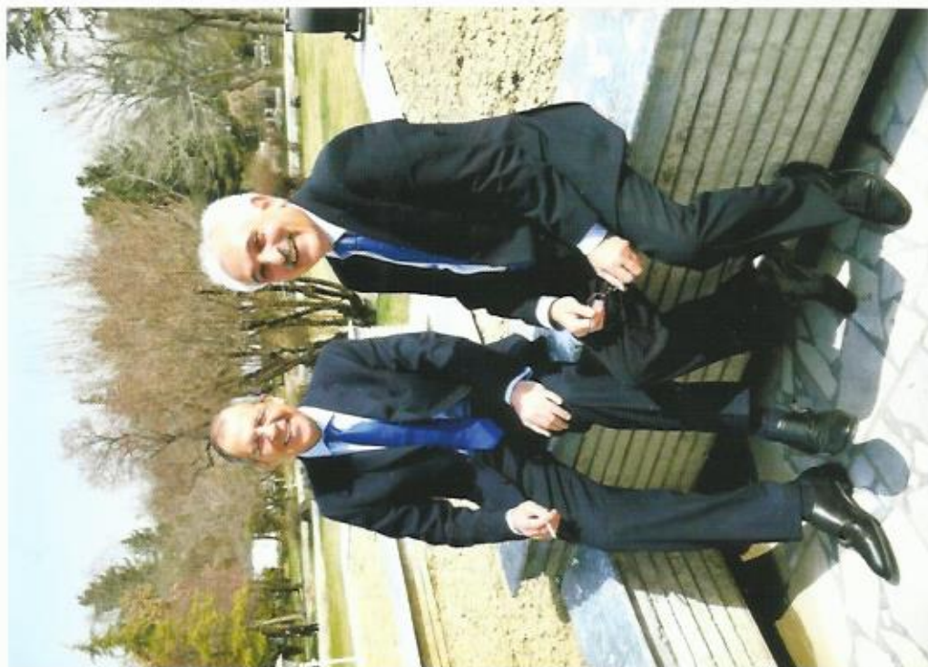
با سرگی لاوروف وزیر خارجه ی فدراتیف روسیه، وزارت خارجه افغانستان، ۲۰۰۸.