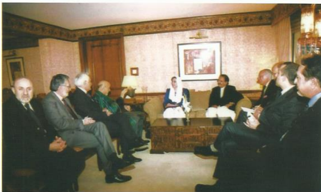
دیدار با خانم بینظیر بوتو، هتل سرینا، اسلام آباد، پاکستان، ۲۰۰۷. (بینظیر بوتو دو سه ساعت پس از این ملاقات کشته شد.)