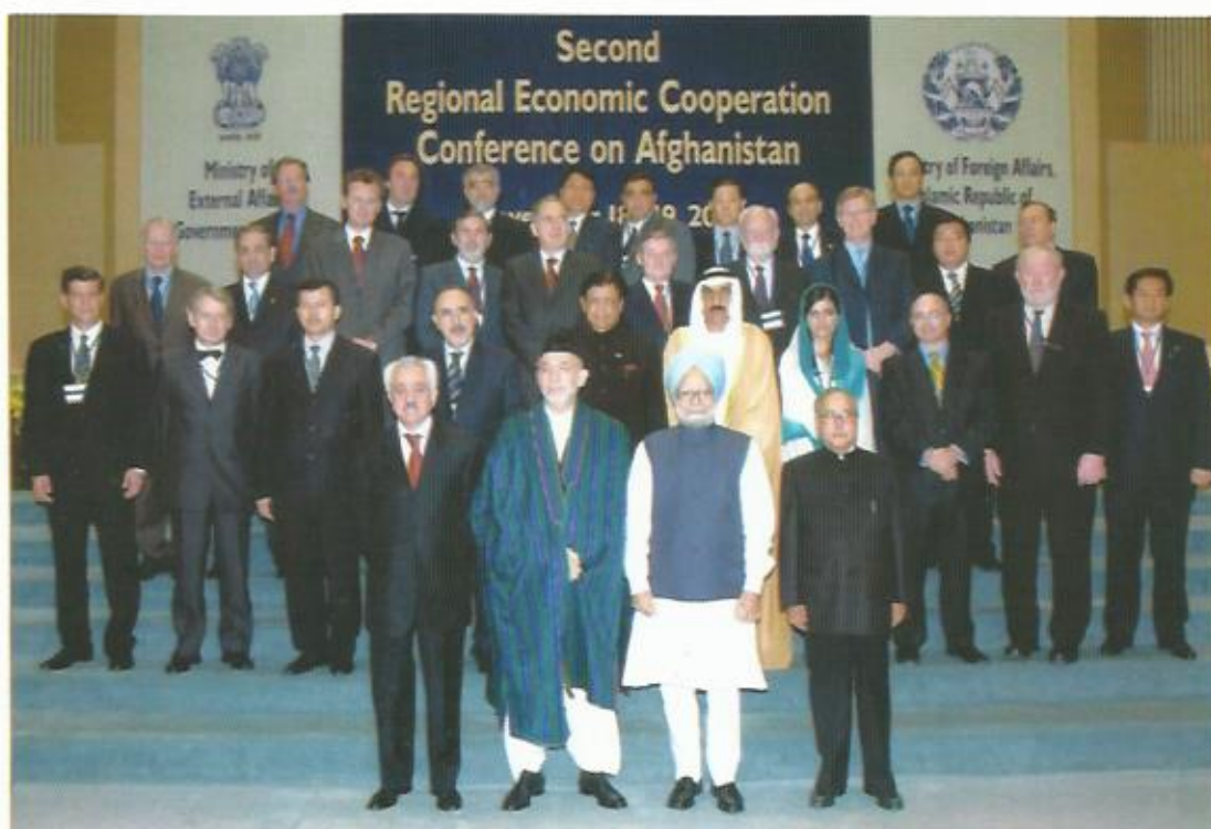
دومین کنفرانس همکاری‌های منطقه‌ای برای افغانستان، دهلی، هند، ۲۰۰۷.