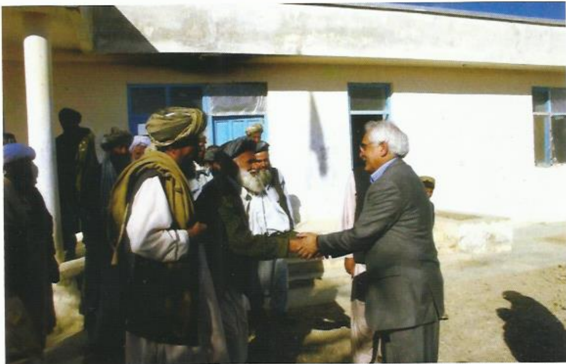
مصافحه با مردم، ولسوالی گرمسیر، ولایت هلمند، ۲۰۰۷.