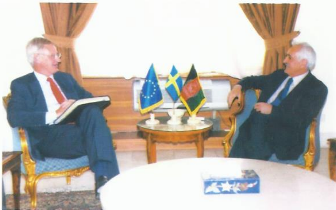
دیدار با کارل بریل، وزیر خارجه‌ی کشور شاهی سویدن، کابل.