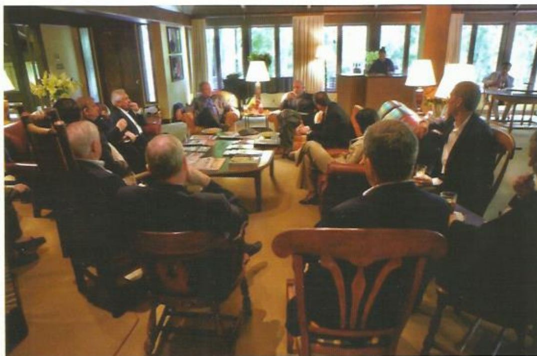
ملاقات کمپ دیوید، ایالات متحده امریکا، ۲۰۰۸.