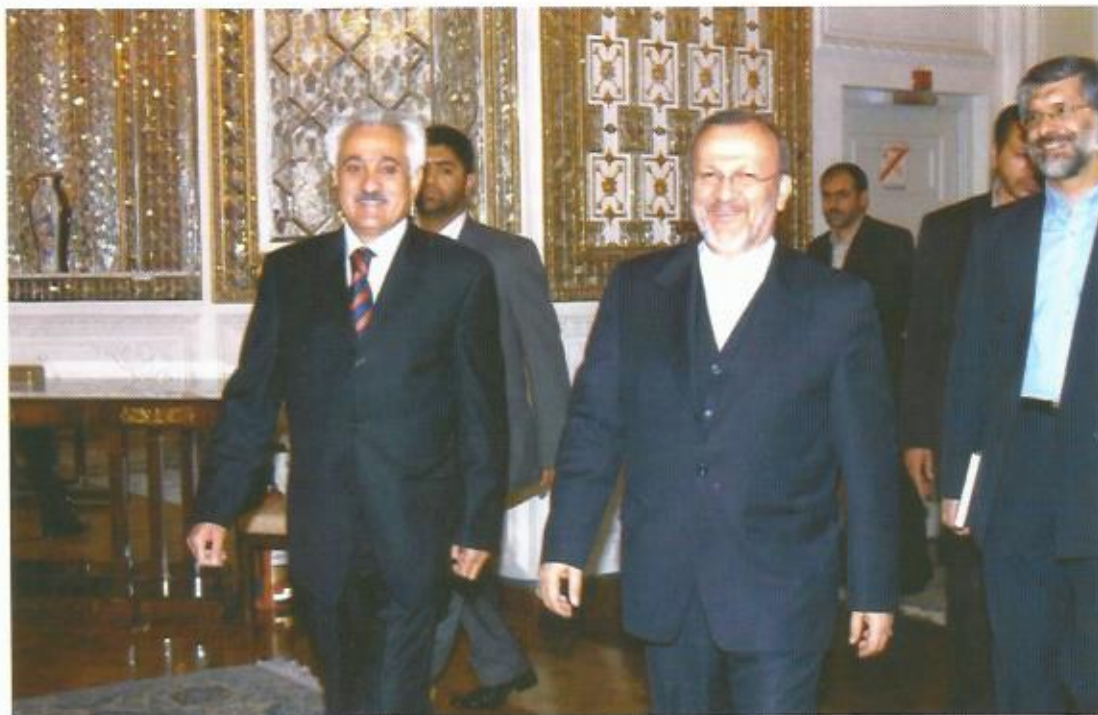
دیدار با منوچهر متکی، وزیر خارجه‌ی جمهوری اسلامی ایران،