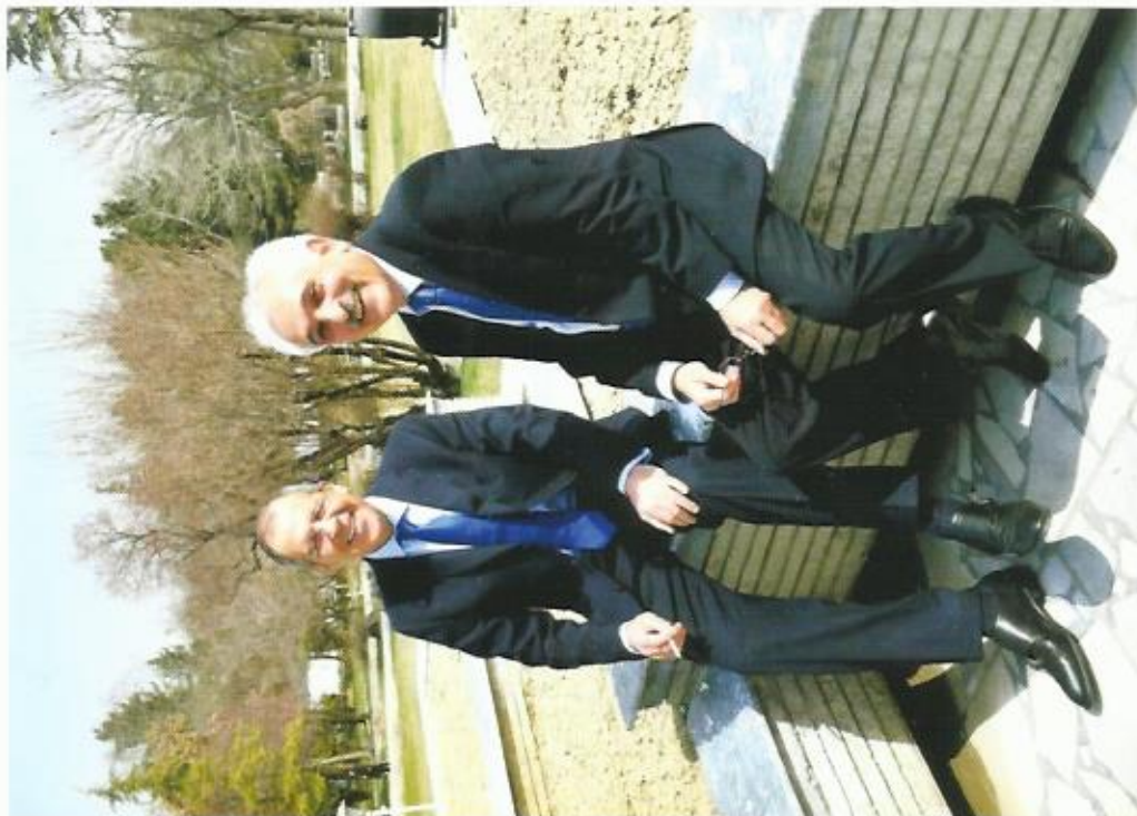
با سرگی لاوروف وزیر خارجه‌ی فدراتیف روسیه، وزارت خارجه افغانستان، ۲۰۰۸.