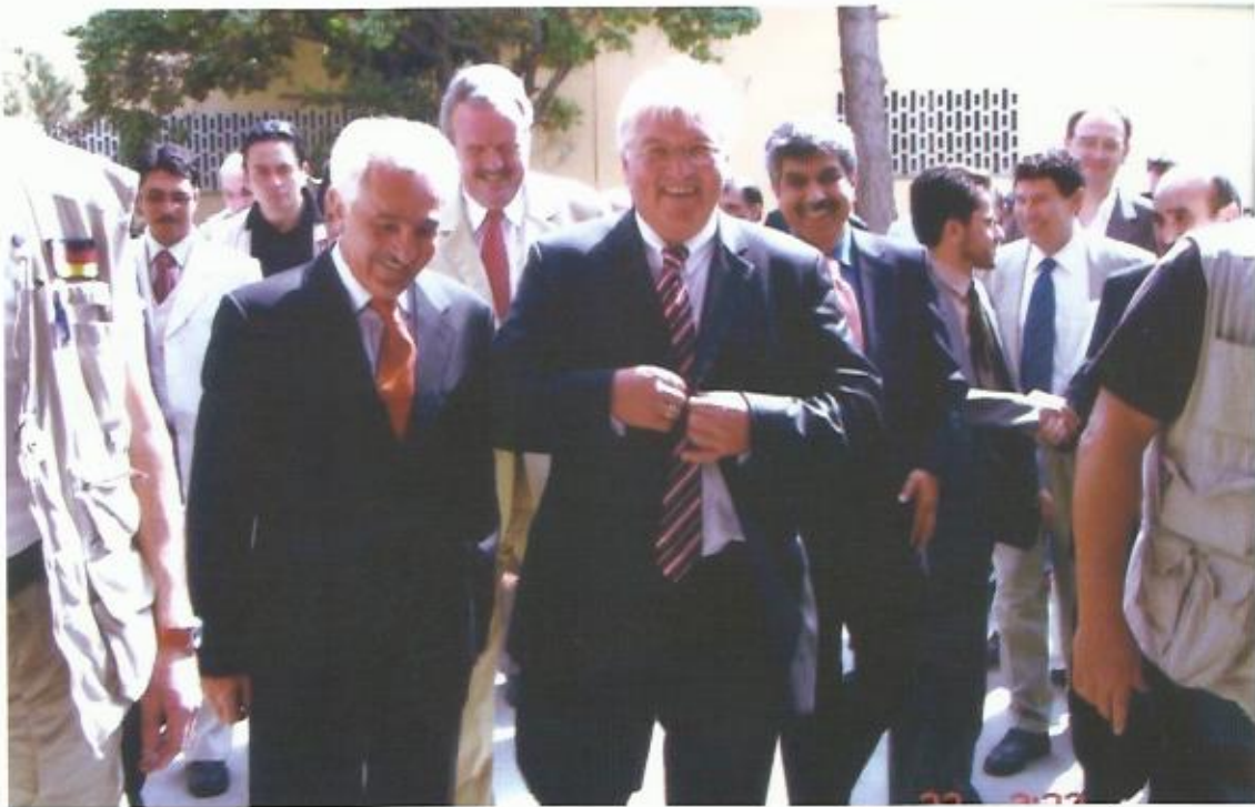
دیدار با فرانک اشتاین مایر وزیر خارجه‌ی پیشین و رییس جمهور کنونی آلمان، ۲۰۰۷.