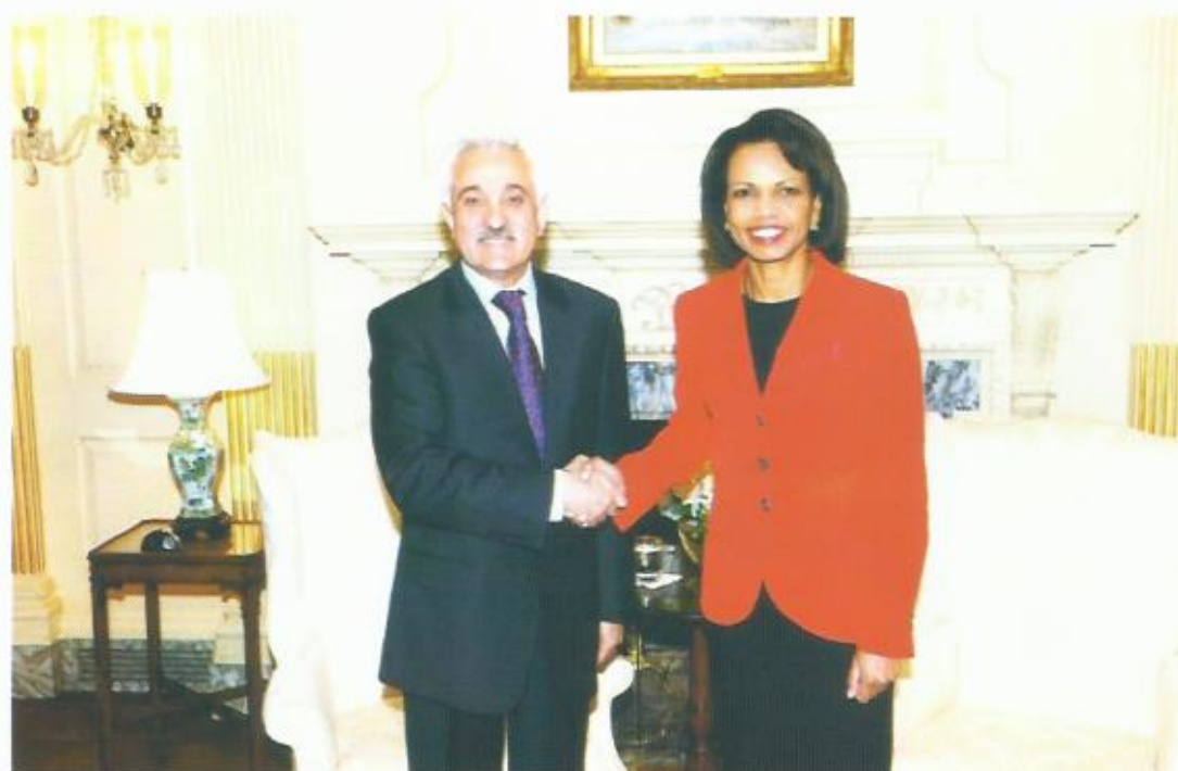
دیدار با خانم کاندولیزا رایس، وزیر خارجه‌ی ایالات متحده امریکا، واشنگتن.