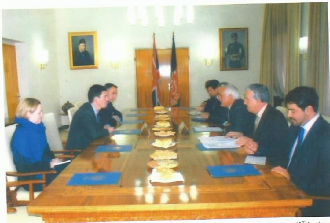
دیدار با آقای دیوید میلبند وزیر خارجه‌ی بریتانیا، کابل، ۲۰۰۸.