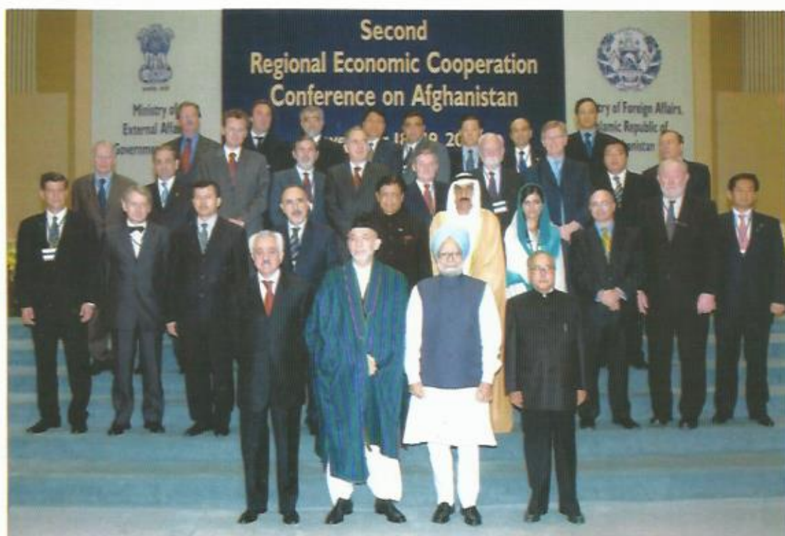
دومین کنفرانس همکاری‌های منطقه‌ای برای افغانستان، دهلی، هند، ۲۰۰۷.