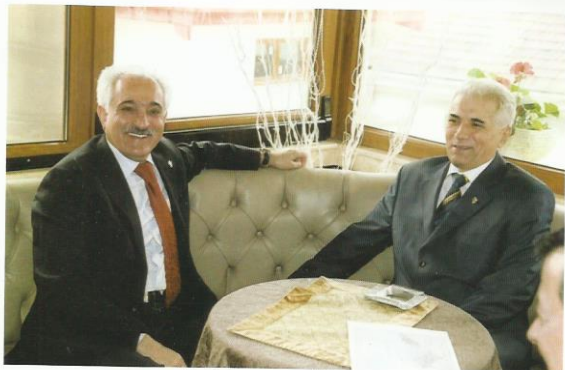
دیدار با همراه خان ظریفی وزیر خارجه‌ی تاجکستان، دوشنبه، تاجکستان،