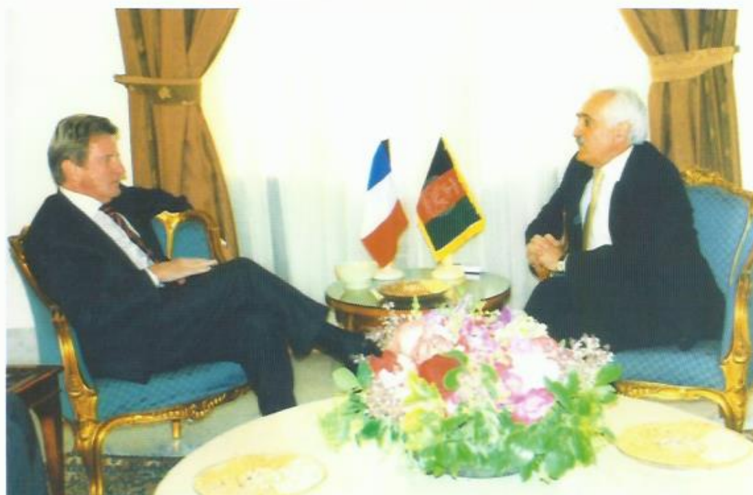
دیدار با برنارد کوشنر، وزیر خارجه‌ی فرانسه، کابل.