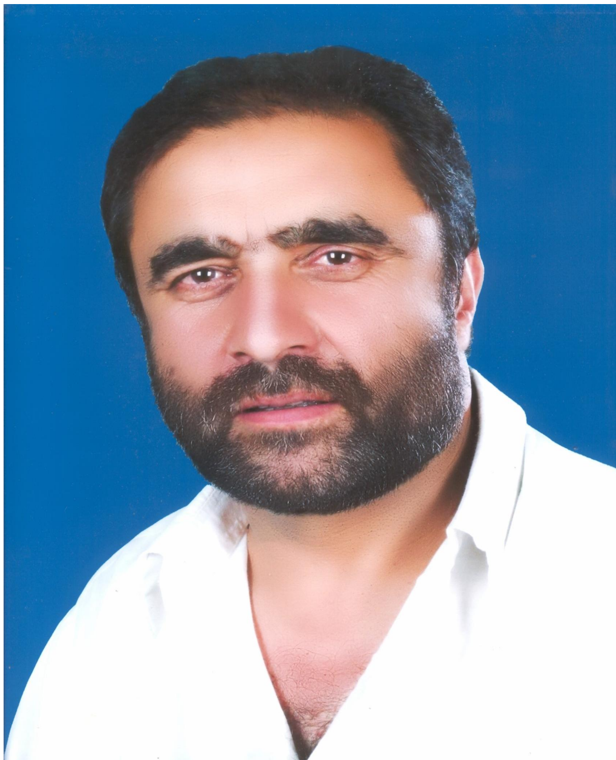
لايق زاده لايق