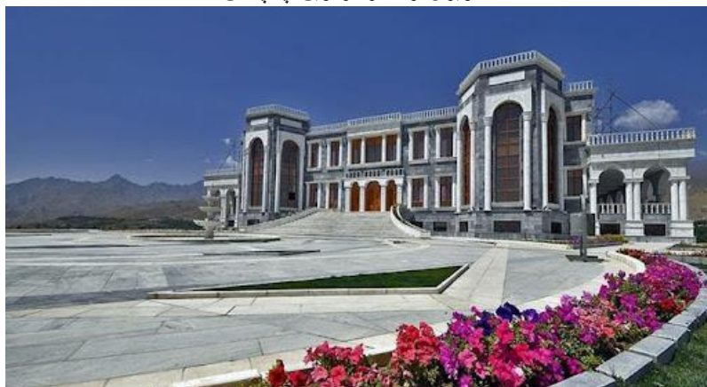
تصویری از قصر مرمین تپه پغمان

ناگفته نباید گذاشت که در فصل های بهار و تابستان خصوصاً جمعه ها مردم زیاد کابل و ولایات برای میله به این مناطق زیبا می روند. نکته ای که باید خاطر نشان کرد این است که اکثراً مردم کابل و ولایات برای میله (گردشگری) به دره پغمان می روند اما قریه هایی