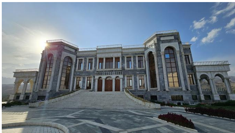
تصویری از قصر مرمین تپه پغمان